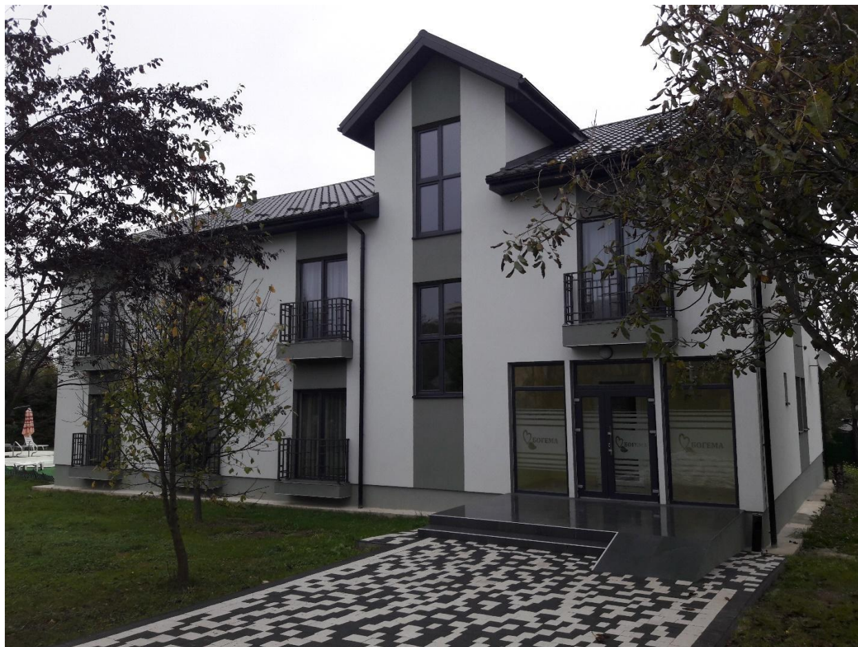
Bogema majutusasutuse kaks kuud tagasi avatud uus maja

Homnikusöök peahoones. Selles söögikohas ei toitlustatud Rootsi laua kohaselt. Istusime laudade taha ja ettekandjad tassisid söögid-joogid kohale. Söök väga mimimalistlik. Kaks väikest saiaviilu, veidi võid, kaks vorstiviilu, üks juustuviil, mingisugune pisikene praetud koogitaoline asi, tiba porgandisalatit ja tilluke õunakook. Õunakook oli väga maitsev. Toit oli ammu söödud, kui tuldi küsima, et kas tahame teed või kohvi. Nüüd võttis veel vähemalt viis minutit, kui jook saabus. Kohv oli maitsev.