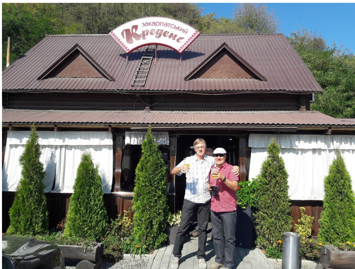
Selles kohvikus sõime lõunat ja jõime õlut enne Mukatševo poole asumist

Lõunastamise kohaks teeäärne kohvik. Söök maitsev, aga õlle saamine võttis kaua aega. Mõnele laudkonnale toodi õlled lauda kiiresti, kuid mõnele lauale ei toodudki. Suundusime siis ise baarileti juurde ja saime õlled kiiresti kätte. Õlle eest tasusime ise.