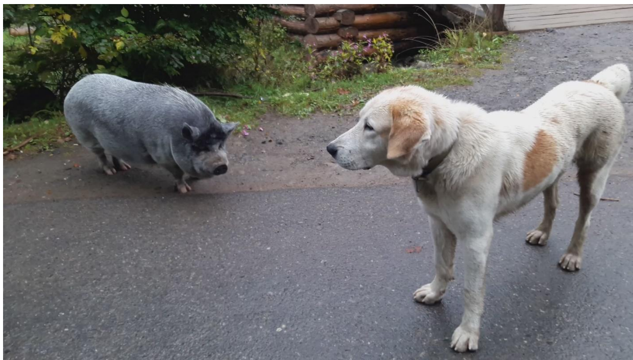
See pilt kuulub eelmise lehekülje jutu juurde

jõudnudki. Puudu olid toolid. Minul oli näiteks sülearvuti kaasas, ning ma olin sunnitud põlvitama laua taga. Aga see oli võimlemise eest. Tubadesse sisenemise magnetkaarte oli esialgu igale toale üks, aga elanikke oli toas ju kaks Aga saime hakkama ja kõik oli hästi.