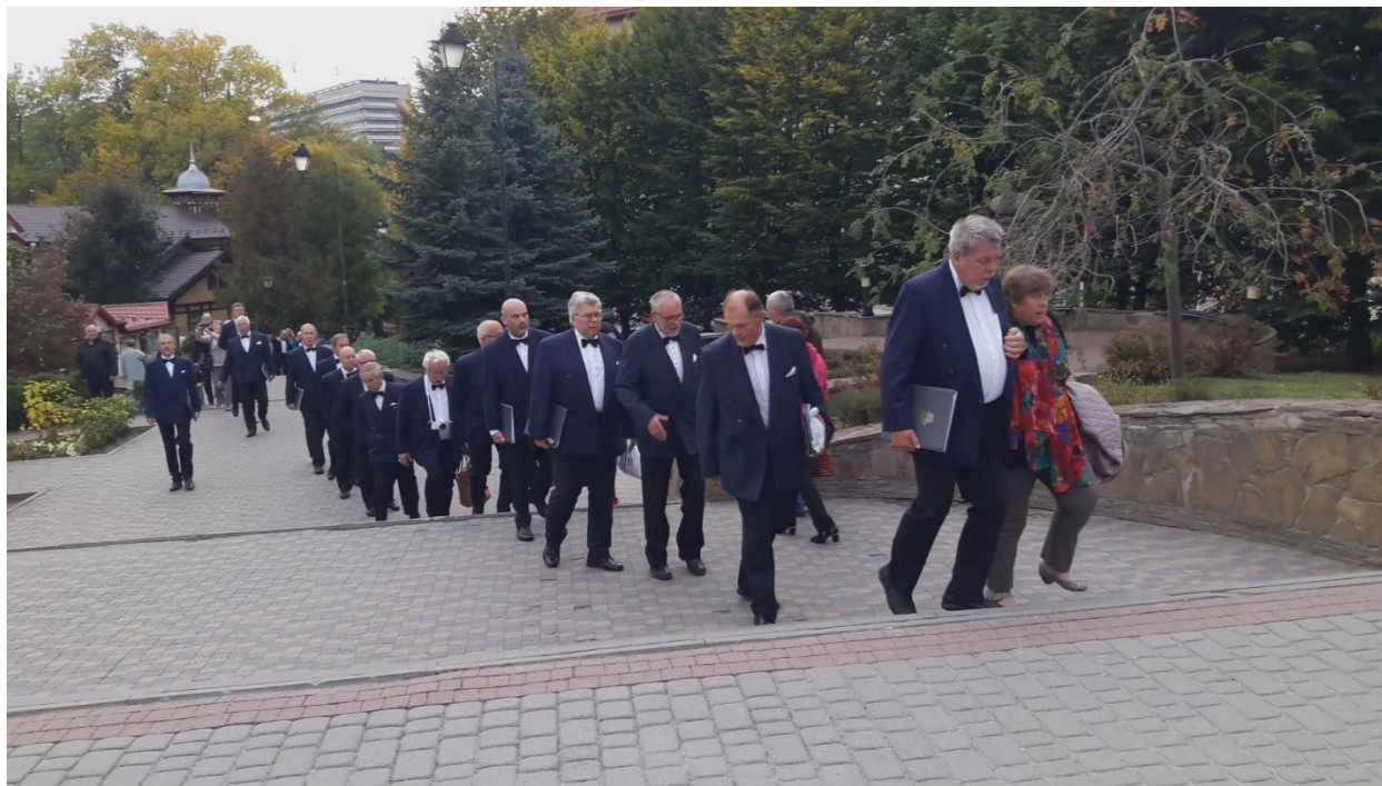
Kontserdipaigast busi juurde tagasi